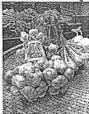
กระเทียมตัดลอน