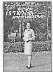
ชุดเครื่องแบบข้าราชการสีทากีแขนยาว