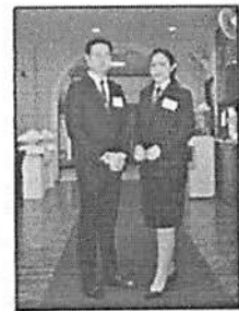
เครื่องแบบ/ชุดระหว่างฝึกอบรม