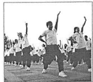
ชุดออกกำลังกาย