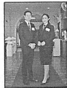
เครื่องแบบ/ชุดระหว่างฝึกอบรม

ตัวอย่างการแต่งกายของผู้เข้ารับการฝึกอบรม