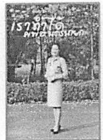
ชุดเครื่องแบบข้าราชการสีทึบก็แขนยาว