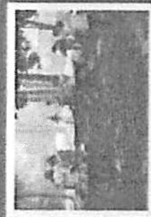
กิจกรรมนำเที่ยว สาธิตและประเมิน