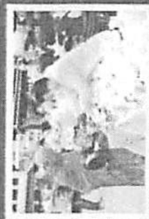
กิจกรรมพิธีทางศาสนา