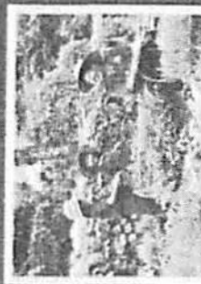
กิจกรรมการน้อมนำหลักปรัชญาของ เศรษฐกิจพอเพียงไปปฏิบัติ