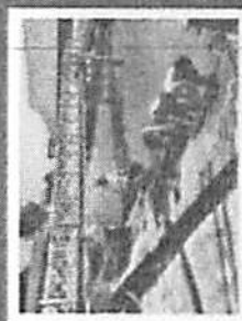
กิจกรรมการบริหารจัดการรวมชาติ และสิ่งแวดล้อม