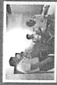
กิจกรรมการประกวดสาระ ผู้ยากไร้