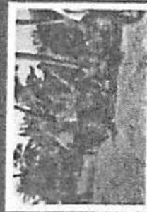
กิจกรรมการป้องกันและแก้ไข ปัญหายากยิว