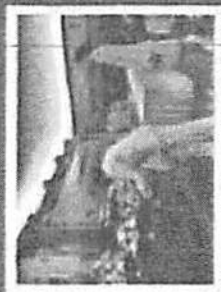
กิจกรรมถวายราชสดุดี พิธีถวายพวงมาลัยดอกไม้ราชสดุดีถวาย ถวายราชสดุดีเนื่องในวันพ่อแห่งชาติ