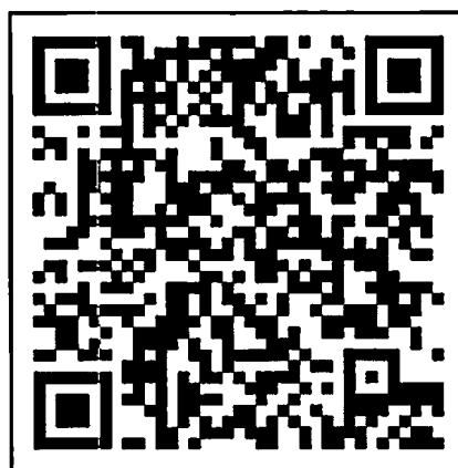
คำสั่งกรรมการพัฒนาชุมชน ที่ 1449/2564 ลงวันที่ 11 ตุลาคม พ.ศ. 2564