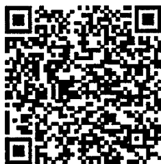
QR Code แบบรายงาน ฯ