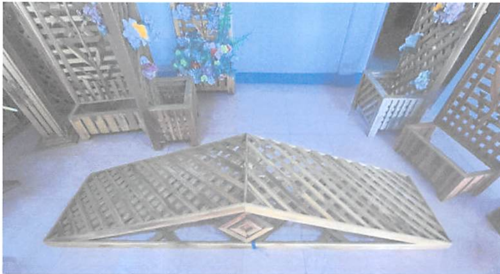
รายละเอียดคุณลักษณะ : หลังคาทรงจั่ว มีขนาดกว้างด้านล่าง ๒๐๐ ซม. ทำด้วยไม้สัก ทรงจั่ว มีลักษณะเอียง แต่ละข้างจะมีขนาดยาว ๑๐๐ ซม. กว้าง ๔๕ ซม.

รายการวัสดุที่ ๓. จ้างจัดทำ ป้ายสติ๊กเกอร์พลาสติก ขนาด ๑๒๐x๒๔๐ ซม.