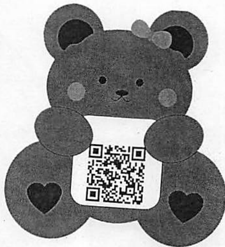
Facebook นวัตกรรม