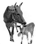
โคแล้นกรอบกรัว