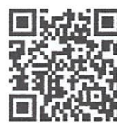
ช่องทางจัดส่งเอกสาร ถอดบทเรียนและวีดิทัศน์