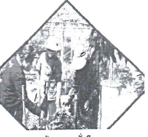
สร้างความยั่งยืน