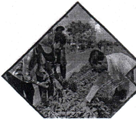
สร้างความมั่นคง